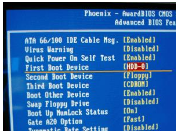
Figura 3 - Opzioni di boot del BIOS