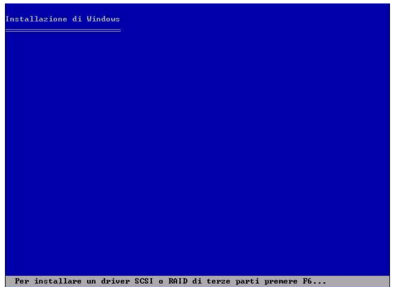
Figura 4 - Schermata di richiesta di installazione dei drivers SATA