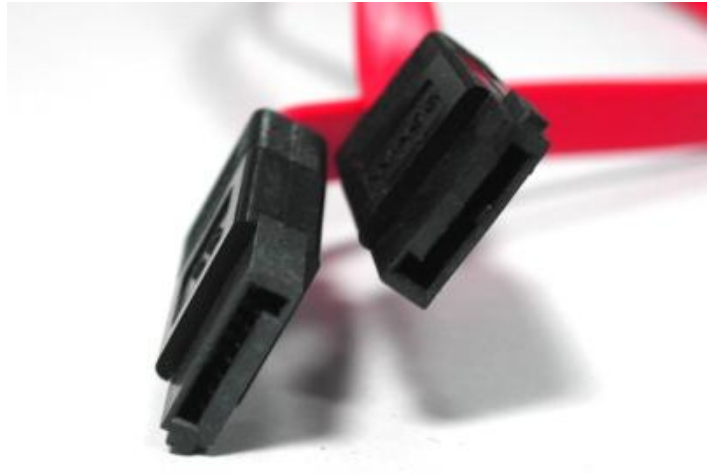
Figura 1 - Cavetti SATA

E' bene quindi seguire le procedure sotto riportate per eseguire correttamente l'operazione.